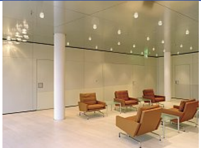
EnBW Berlin, Spreekarree