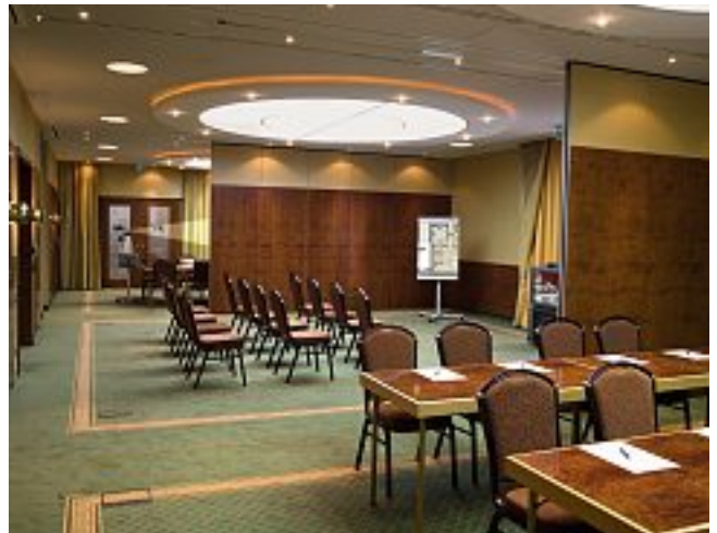
Hotel Kaiserhof, Münster