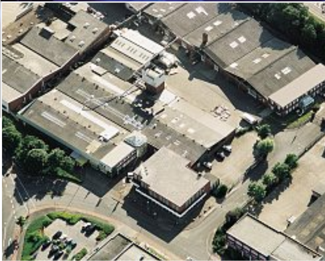
Nüsing-Werk in Münster