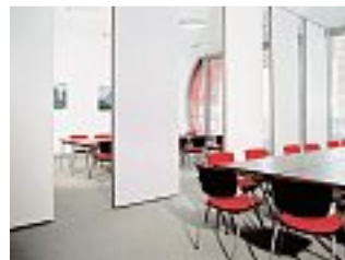
Feldhaus Fassaden, Emsdetten