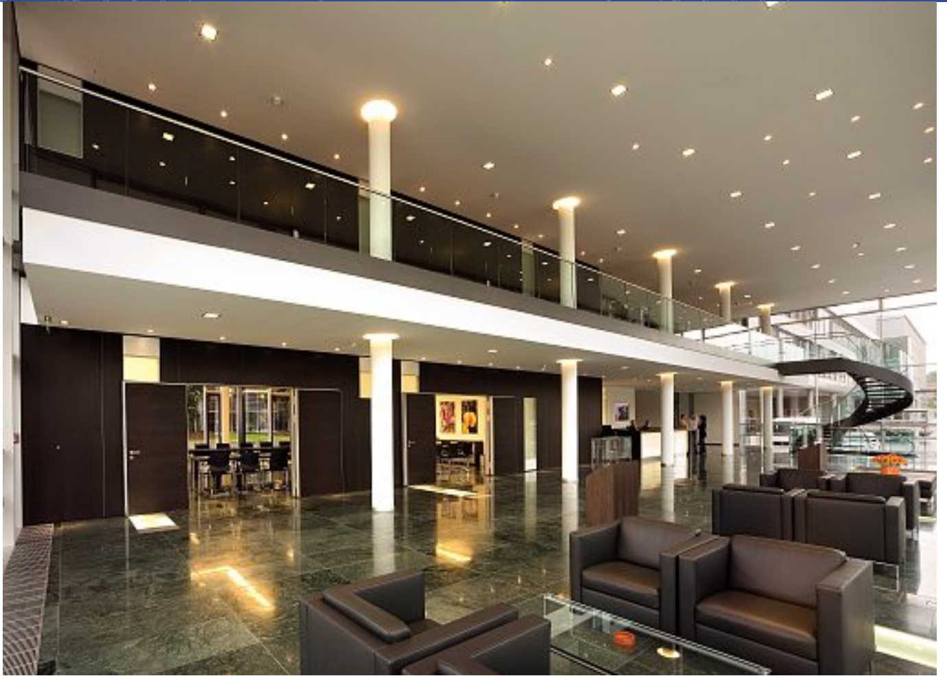
Jägermeister Verwaltungsgebäude, Wolfenbüttel