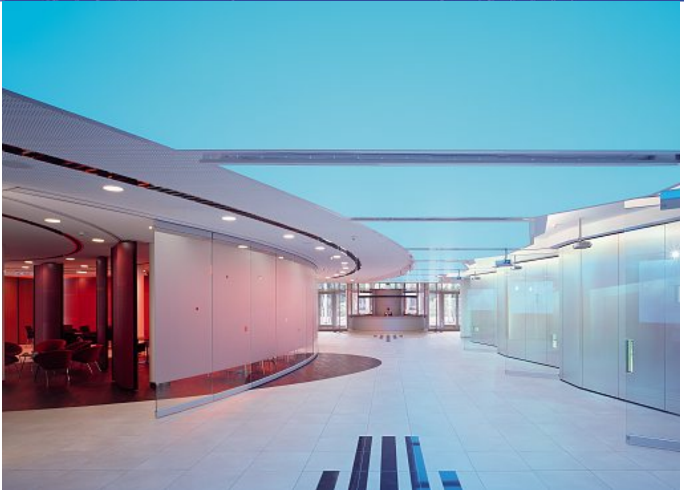
Stadthalle Mülheim (Ruhr)