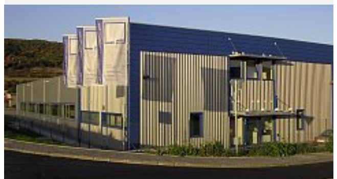
Nüsing-Werk in Tschechien