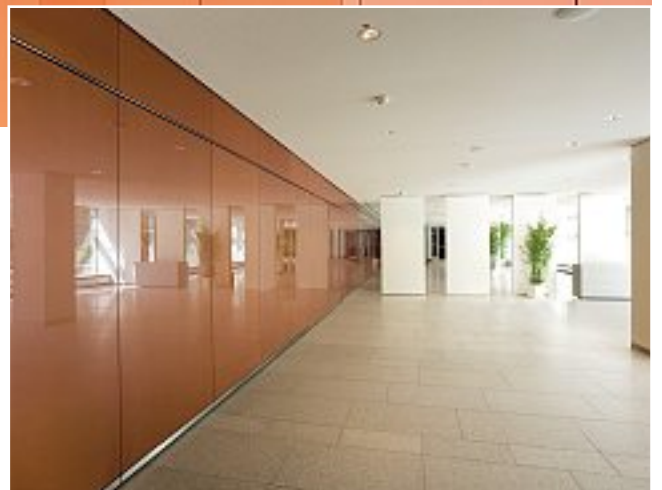
KfW Kreditanstalt für Wiederaufbau, Frankfurt