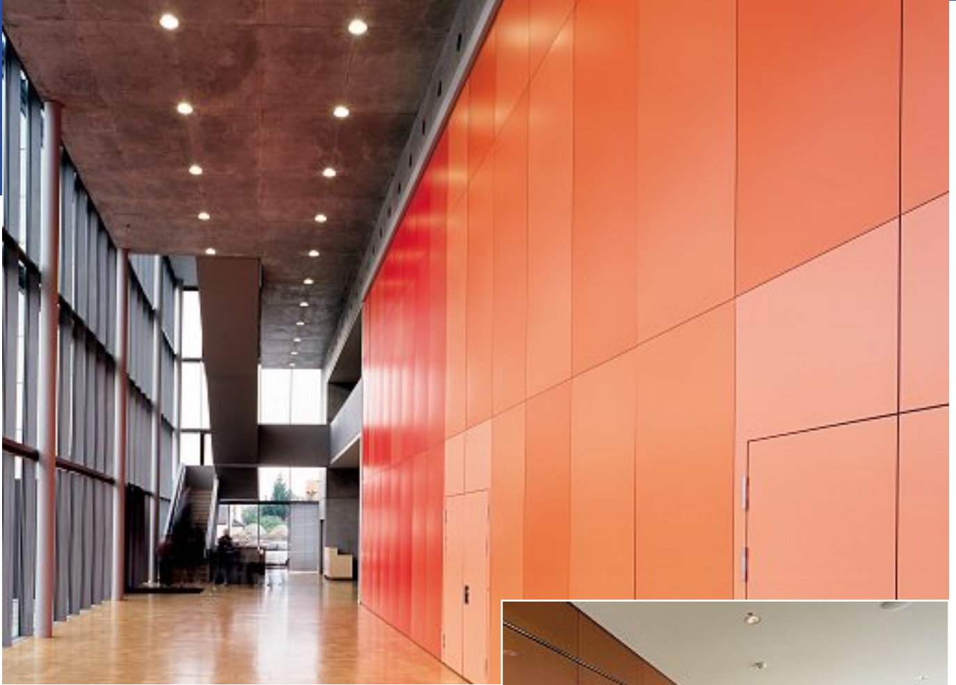
Kulturzentrum Uhingen, AUDITORIUM