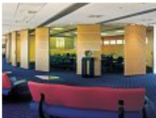
ING Bank, Amsterdam